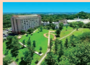
つま恋リゾート彩の郷