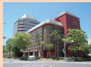
掛川グランドホテル