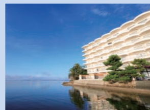
ホテルグリーンプラザ浜名湖